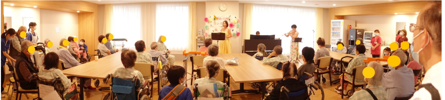
11月1日（金）に開催した新病院では初めての「秋の院内コンサート」の様子。総勢80名を超える参加者がありました。

当院では、入院療養中の皆さんに「癒しや喜びを感じていただく」ために、様々な催しを開催しています。今回は、11月に4階(回復期リハビリテーション病棟)、7月と10月に8階(緩和ケア病棟)で開催したイベントの様子をご紹介します。