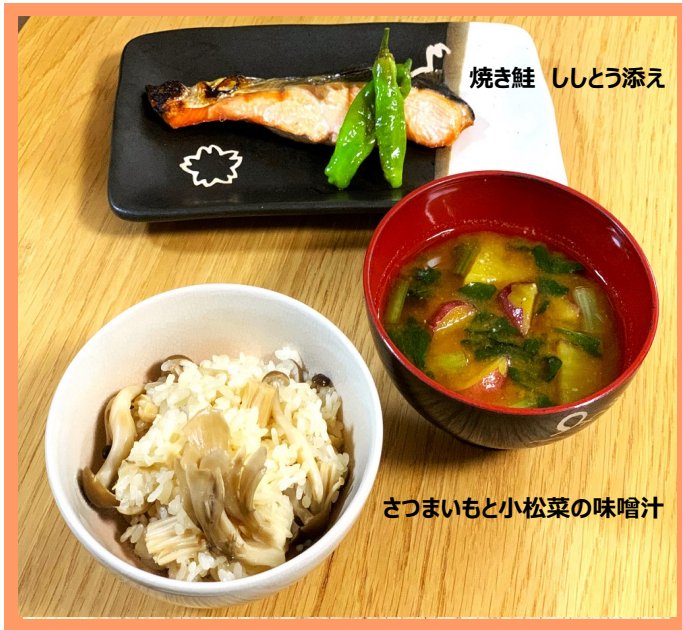
焼き鮭 ししとう添え